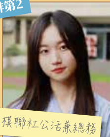
猴聯社公活兼總務