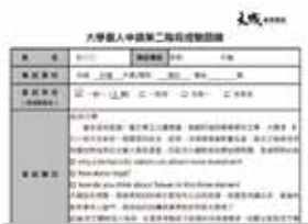
各校系面試考古題+學長姐經驗回饋

模擬面試 現場將以4關模擬面試訓練(含個人面試及團體面試)，現場即時評比及回饋，考核表上紀錄模擬面試時的優缺點，幫助同學了解自己面試時的狀況。