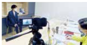
四關模擬面試訓練 (含個人面試及團體面試)