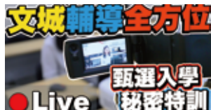
文城輔導全方位!大學教授親臨指導? 甄選入學秘密特訓 Live!