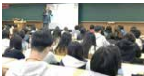
學習歷程檔案講座