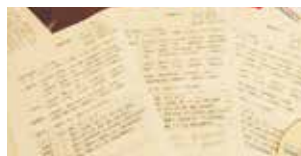
領取考核表, 雲端觀看面試過程